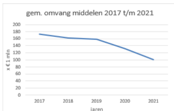
Grafiek 4.1: Gemiddelde omvang middelen